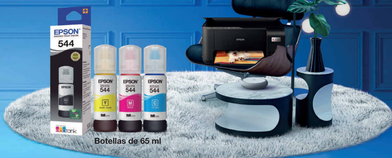
Botellas de 65 ml

Mantenga su EcoTank® 100% Epson con tintas originales.